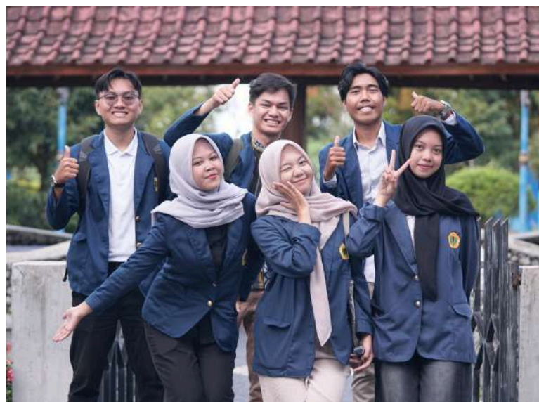
Mahasiswa Ilmu Lingkungan Universitas Mataram di WTP PTAM Giri Menang

Para peserta diajak menelusuri Instalasi Pengolahan Air (WTP) milik PTAM Giri Menang untuk melihat tahapan penting seperti proses pengambilan air baku, pengolahan fisik dan kimia, pengujian kualitas air, hingga distribusi ke pelanggan. Penjelasan disampaikan langsung oleh tim operasional dan laboratorium yang berpengalaman di bidangnya.