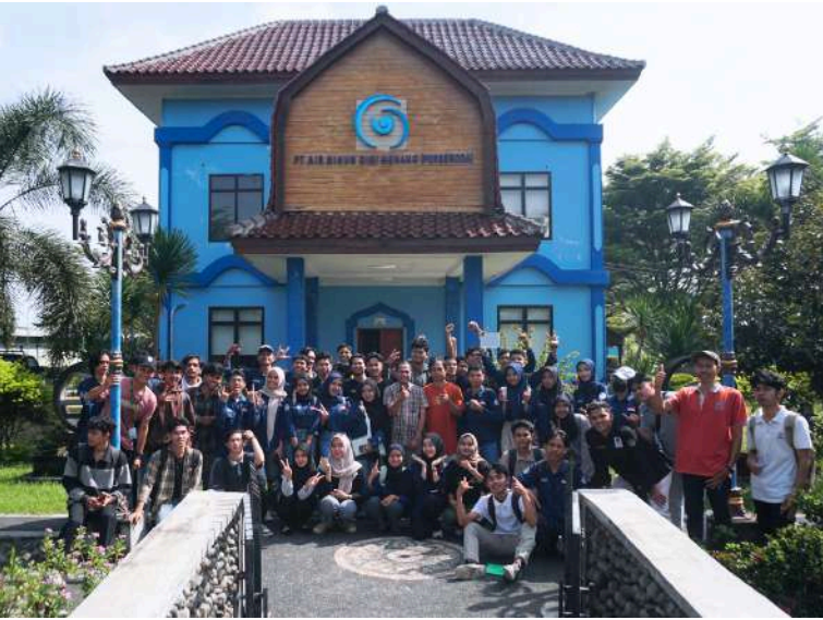
Mahasiswa Universitas Mandalika di WTP PTAM Giri Menang