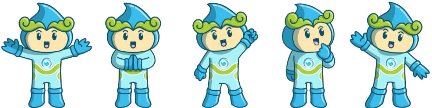
Nama maskot PT AMGM adalah si “TIU” yang artinya mata air atau sumber air

“Mewujudkan Layanan Prima 24 Jam, Sehat, dan Lingkungan Lestari (PRESTASI)”. Dengan semangat baru, PTAM Giri Menang terus berkomitmen untuk berinovasi, memperluas jangkauan layanan, serta menjadi perusahaan air minum daerah yang modern, responsif, dan berdaya saing.