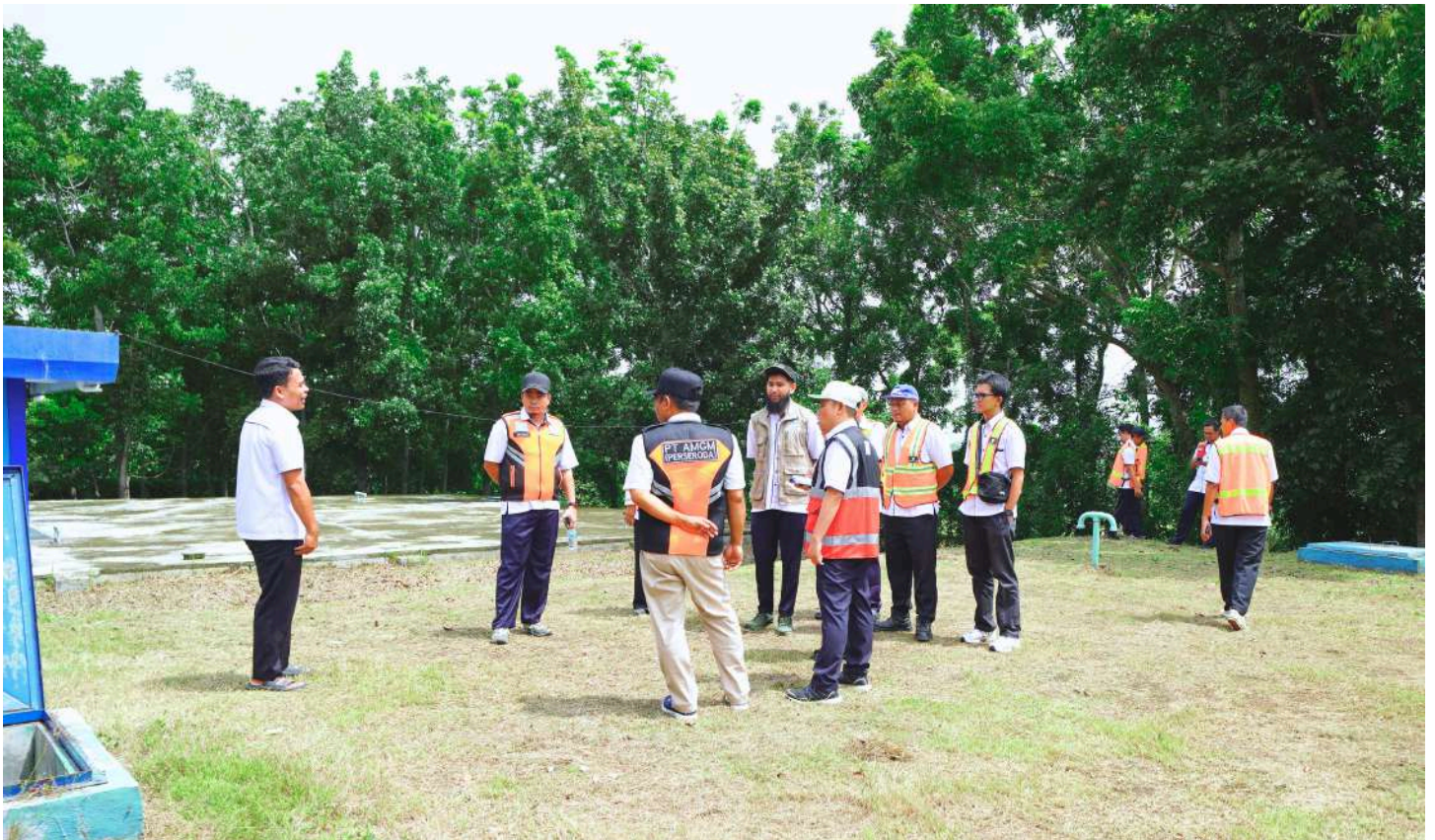
Direksi dan para manager hingga staf berada di reaervoir bug-bug